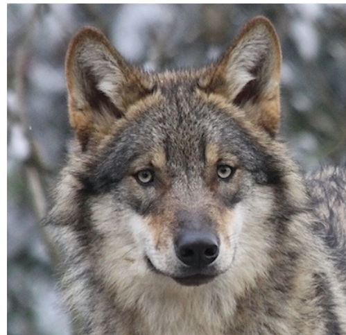
Le loup gris